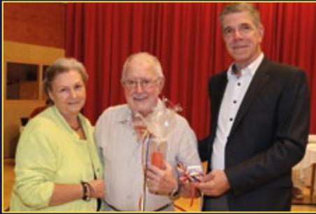
Johann Zweigelt (95)