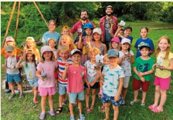
Bei den Pfadfindern

Mit insgesamt rund 600 Ferienspielteilnahmen war das diesjährige Ferienspiel eines der erfolgreichsten in Biedermansdorf. In Summe wurden von der Marktgemeinde Biedermansdorf in sechs Wochen 26 verschiedene Veranstaltungen zu den unterschiedlichsten Themenbereichen für Kinder von 4 – 15 Jahre organisiert. Dazu zählten zahlreiche Ausflüge wie z.B. zum Flughafen, ORF (mit exklusiver Führung im Newsroom), zur Nationalbibliothek oder zum Ninja Warrior Erlebnispark, ein Besuch bei der Polizei, die Zirkuswerkstatt u.v.m.