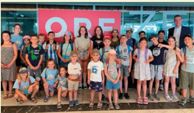
Ausflug zum ORF

Natürlich waren diesmal auch wieder die beliebten Fixpunkte wie die „Action am Bauhof“ der Tag bei der Feuerwehr, das Wettschwimmen oder der Smashpoint Tennisfloh Kidsday im Programm. Neu waren in diesem Jahr u.a. das Meerjungfrauenschwimmen, der Capoeira-Schnupperkurs des KSV und für alle Hundefreunde gab es gleich zwei Veranstaltungen des ÖKV und des Austriadogtrainingcenter. Auch der Motorradclub Final Dawn MC war diesmal wieder mit dabei. Und mit dem Elternverein ging es zu einer spannenden Eiszeitreise