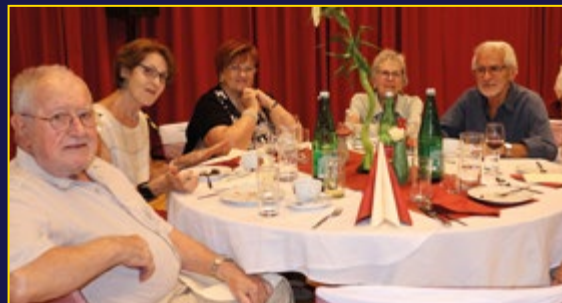
In geselliger Runde...