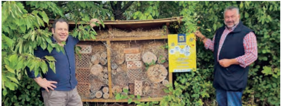
Das Bienenhotel beim Gemeindeteich

wurde auf den Einsatz von Blühstreifen und Hecken hingewiesen, die Bienen einen besonderen Lebensraum bieten. Vor dem Gemeindeamt führt eine Tafel „Bienenbuffet“ mittels QR-Codes zu Tipps für einen bienenfreundlichen Garten, Balkon oder Terrasse.