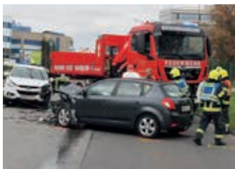
Fahrzeugbergung nach Verkehrsunfall IZ Süd

durch einen Atemschutztrupp ausgeräumt und der Kamin mittels Wärmebildkamera kontrolliert. Auch eine Kontrolle von außen mit dem Krankkorb des Wechselladerfahrzeugs erfolgte. Nach Beziehung eines Rauchfangkehrers konnte rasch Entwarnung gegeben werden. Recht spektakulär klang eine Alarmierung am 24. Oktober. Wir wurden zu einer vermeintlichen Explosion in ein Reihenhaus in die Viktor-Kaplan-Straße alarmiert. Aufgrund der Alarmmeldung disponierte der Disponent der Bereichsalarmlentrale Mödling auch die Feuerwehren aus Laxenburg, Wr. Neudorf und Vösendorf zu diesem Einsatz. Nach intensiver Erkundung konnte keine Explosion und kein Brand festgestellt werden. Es handelte sich vermutlich um eine Fehlzündung einer Heizungsanlage . Nach Kontrolle des Reihenhauses unter Beziehung des Bereitschaftsdienstes der EVN (Gaswerk) konnte schließlich Entwarnung gegeben werden und alle Kräfte konnten wieder in ihre Feuerwehrhäuser einrücken. Im Bereich der technischen Einsätze beschäftigen uns zahlreiche Verkehrsunfälle im Ortsgebiet, aber auch im Industriezentrum Süd.