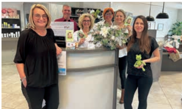
Das Team von „Konny's Meisterschnitt“ sammelt Spenden für die Mobile Kinderkrankenpflege (MOKI)