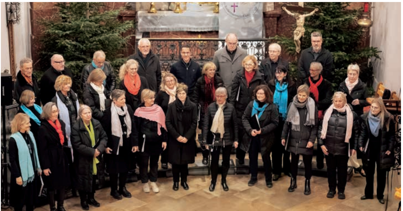
Weihnachtskonzert 2024

Das ArtEnsemble freut sich auf dich / Sie!