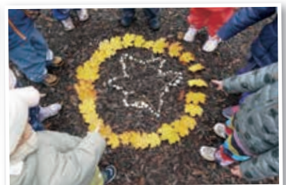
Achtsamkeitsübung: ein Herbstmandala gestalten