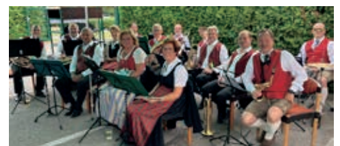
Sommerfest im Kleingarten