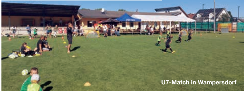
U7-Match in Wampersdorf