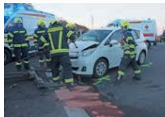
Fahrzeugbergung nach Verkehrsunfall B11

Leider waren dabei auch einige Verletzte zu beklagen . Die Feuerwehr führte die Fahrzeugbergungen durch und reinigte die Fahrbahn. Am Friedhofsweg stürzte ein Baum um und blockierte dadurch die Fahrbahn. Auch hier mussten wir die Fahrbahn wieder freimachen. Insgesamt halten sich die Einsatzzahlen auch in diesem Jahr auf sehr hohem Niveau. Rund 240 Einsätze mussten im Jahr 2025 bis