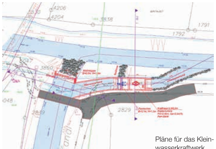
Pläne für das Kleinwasserkraftwerk

Die Projekteinreichung für das Kleinwasserkraftwerk am Wiener Neustädter Kanal wurde bei der Bezirkshauptmannschaft Mödling eingereicht. Wir hoffen auf eine rasche Bauverhandlung und eine positive Genehmigung!